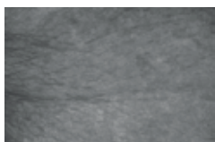
APRÈS LA CURE DE 3 TRAITEMENTS + 1 SEMAINE DE RÉMANENCE***

βP3. TRI·COMPLEX™ SAFRAN SOPHORA PEPTIDES